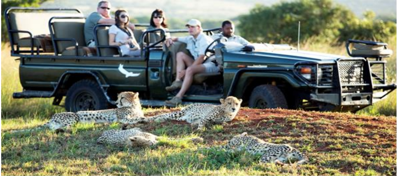
Os Safaris continuam a ser uma das maiores atrações turísticas na África do Sul